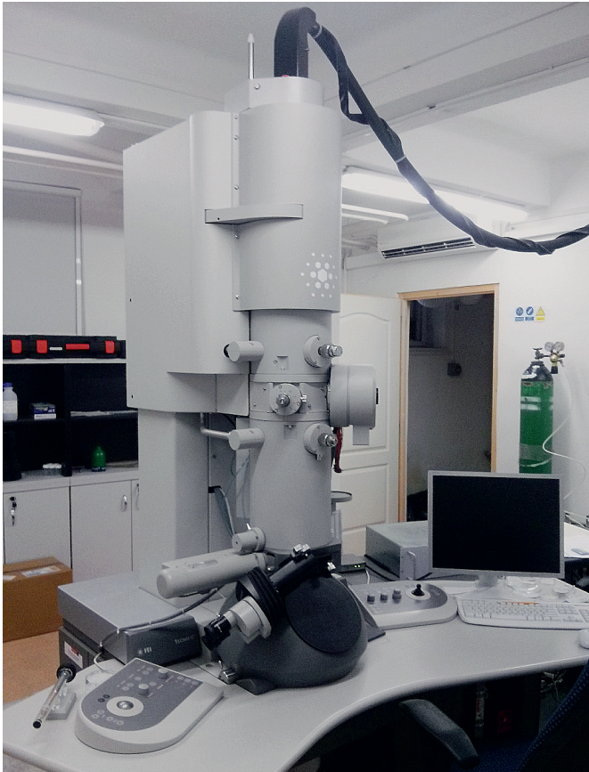
2. ábra. Az Intézet nagy felbontású transzmissziós elektronmikroszkópja